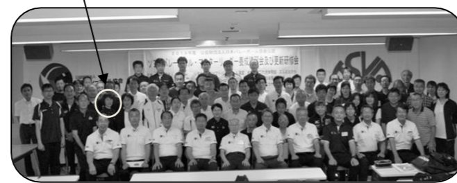
更新取得者で記念撮影