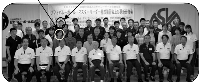
新規取得者で記念撮影